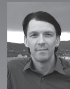
Point de vue

En matière de réglementation du génie génétique, la Suisse s'est par le passé régulièrement alignée sur les directives de l'UE. On est donc en droit de penser qu'une modification de la loi européenne serait, par analogie, également adoptée par notre pays. Dans une prise de position parue en fin juin, biorespect et 60 organisations partenaires se sont élevées contre un assouplissement de la réglementation (pour de plus amples informations, prière de consulter notre site web). Nous y demandons une réglementation stricte, ceci afin de garantir la liberté de choix des consommateurs, d'empêcher la pollution des semences biologiques par le pollen de plantes transgéniques et de garantir la responsabilité des entreprises en cas de dommages ou d'effets problématiques. Tout dépendra maintenant de la décision des États membres de l'UE.