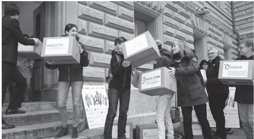
Vom Tag der Einreichung bis zur Volksabstimmung bleibt nicht viel Zeit: Der Termin steht mit dem 4. Juni bereits fest.

Neues Kino Basel, Klybeckstrasse 247. Eintritt frei, Kollekte.