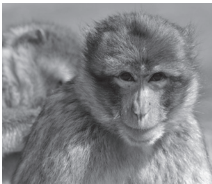
Die Belastung der Tiere wird in der Forschung gern verharmlost.