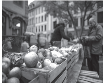
Gentech-Lebensmittel sind in der Schweiz nach wie vor verpönt.

Der Bundesrat begründet die Moratoriumsverlängerung damit, Zeit für eine «gründliche und sachliche» Diskussion eines möglichen künftigen Einsatzes von