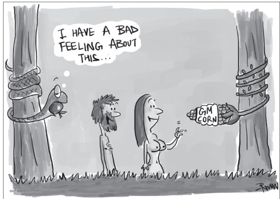
Cartoon: Rohan Chakravarty